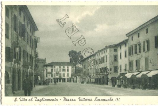
S. Vito al Tagliamento - Piazza Vittorio Emanuele III