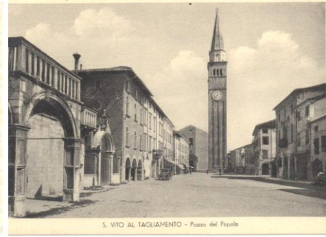
S. VITO AL TAGLIAMENTO - Piazza del Popolo