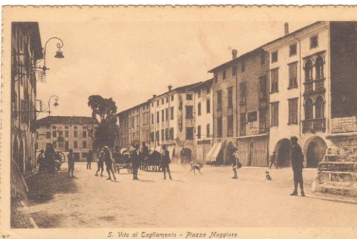
S. Vito al Tagliamento - Piazza Maggiore