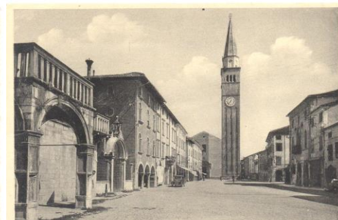
S. VITO AL TAGLIAMENTO - Piazza del Popolo