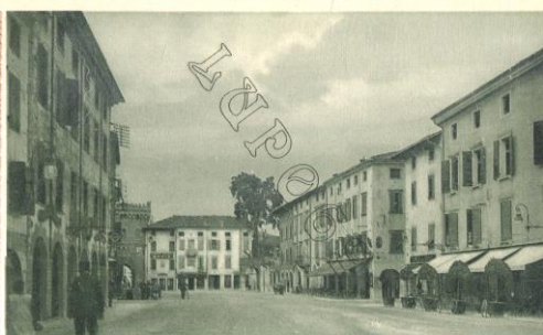
S. Vito al Tagliamento - Piazza Vittorio Emanuele III