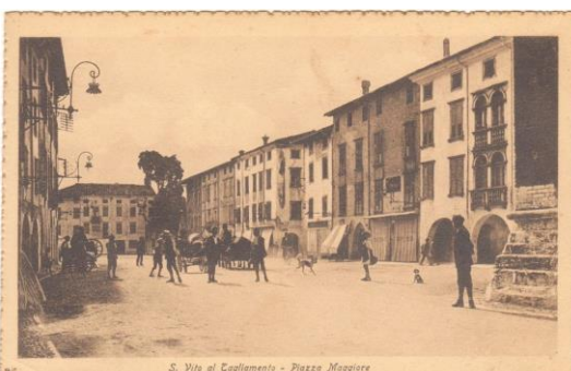
S. Vito al Tagliamento - Piazza Maggiore